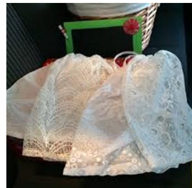
Izvedbena aktivnost okoljskega ozaveščanja

OKP Rogaška Slatina d.o.o. bo skupaj z Okoljsko raziskovalnim zavodom sodeloval pri izvedbi kampanje za ozaveščanje javnosti glede škodljivega vpliva pretirane potrošnje lahkih plastičnih nosilnih vrečk. V letu 2018 bodo v ta namen potekale aktivnosti ozaveščanja mladih v vrtcih in šolah, kar bo posredno vplivalo tudi na povečano informiranost širše javnosti.